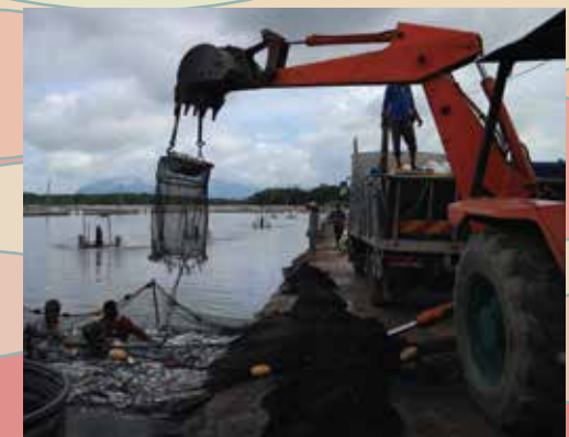
PENUAIAN DAN PENGANGKUTAN